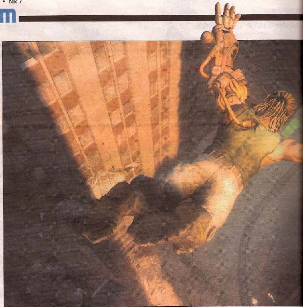
Den stora utmaningen med att ta Bionic Commando till konsolerna Playstation 3 och Xbox 360 är att

LTE Nästa generations mobilnät, LTE, klarar nu datahastigheter på över 300 megabit/s. Ätminstone i labbmiljö och med bara en användare. Försöken har genomförts av LSTI, en grupp bestående